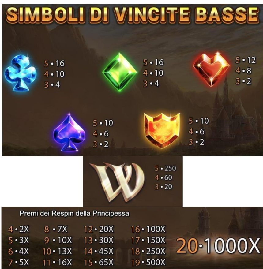
TABELLA DEI PAGAMENTI